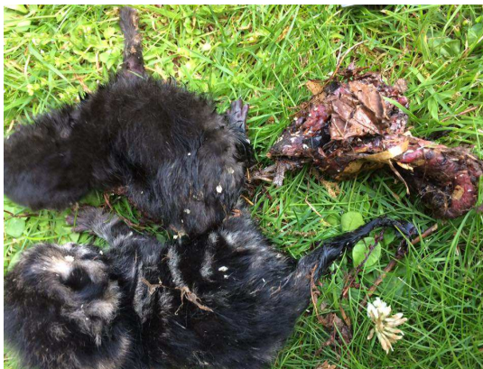
Unerwünschter Katzennachwuchs, der einfach „entsorgt“ wurde!

Auch Ihre eigene unkastrierte Katze läuft Gefahr, sich - mit zum Teil tödlichen - Krankheiten zu infizieren!